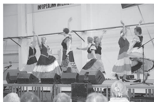
Järvakandi „Vürtsitüdrukud“ esitavad mustlastantsu.